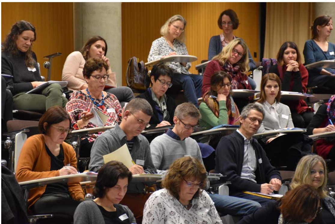
Interessiertes Publikum an der AGAB-Fachtagung 2018

Les présentations du colloque sont à disposition sur notre site ; en partie uniquement en intranet. ( www.agab.ch > Intranet > Archive colloques antérieurs > 2018 // Haute Ecole spécialisée Bernoise, Bienne)