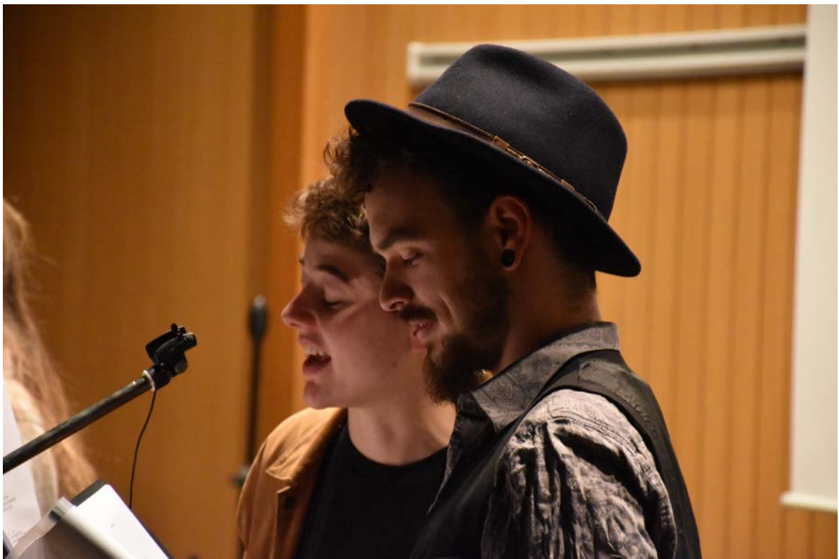
Auftritt von vier Studierenden des Schweizerischen Literaturinstituts, Biel

Un groupe de quatre étudiants de l'Institut littéraire suisse a écrit des textes en lien avec le thème et les a ensuite lus sous forme de performance très rythmée pendant près d'une demi-heure. Les textes posent par exemple la question: Qu'est-ce l'immigration ? Qu'est-ce l'émigration ? Peut-on être les deux à la fois? Que signifie intégration? Peut-on prescrire cela ? Chacun devrait-il être une fois dans sa vie un immigrant, que ce soit économique, social, religieux ou selon d'autres critères? Les textes sont multilingues et abordent ces questions avec beaucoup d'humour.